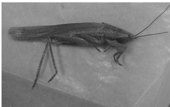
図1 シブイロカヤキリ 普段はうつぶせの状態 かく で葉にぴったりとくっついて隠れている。後脚が短いのは隠れやすいからかもしれない。

21世紀の森と広場ではシブイロカヤキリ(図1)というクビキリギスに近い仲間も時折見ることができます。この虫もクビキリギスと同じように成虫の状態越冬し、4月下旬から7月ごろまでイネ科草本 そうほん の草むら等でクビキリギスよりしわがれた声で「ジャー……」と鳴いているのを聞くことができます。クビキリギスとよく似たとんがり頭をしていますが、クビキリギスほど頭はとがっておらず、後脚 こうきやく も短いためがっしりしているという印象を受けます。またクビキリギスは緑色の個体も褐色 かつしよく の個体も見られますが、この種は褐色の個体しか見られません。慣れればすぐに見分けがつくようになります。