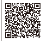
詳細ホームページ