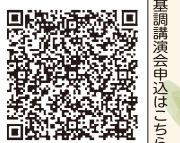
基調講演会申込は「ちば電子申請サービス」

世界の男女平等度を数値化した「ジェンダーギャップ指数」で、日本は衝撃の146か国中125位。世界最下位レベルです。トップに並ぶのは北欧諸国。1位アイスランド、2位ノルウェー、3位フィンランド...ところが、世界第2位のノルウェーも、かつては男性中心でした。ではどのようにして男女格差の小さい社会になったのか。ノルウェーの暮らしや政治を探りながら、日本はなぜこんなに男女格差が大きいのかを考えてみませんか。