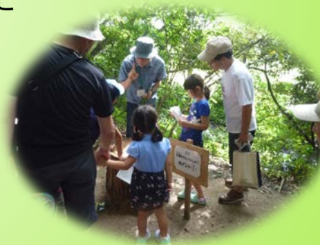
地域の人みんなで子育て