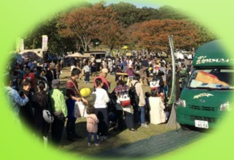
キッチンカーで公園に