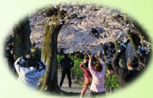
地域の人みんなで健康に