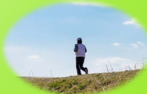
ランニングステーション