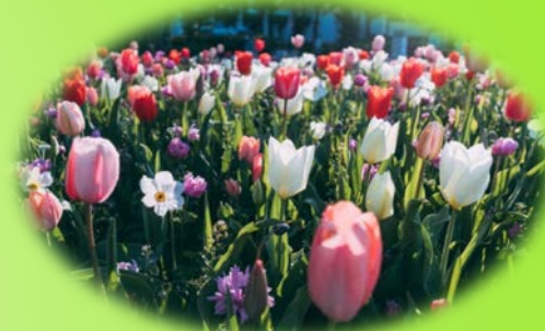
みんなで作る花壇