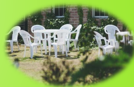
地域の人達の憩いの場