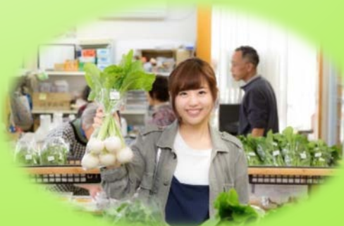
地元農産物の直売所