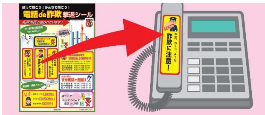
電話de詐欺撃退シール