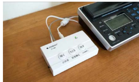
電話de詐欺撃退機器 (自動通話録音機)