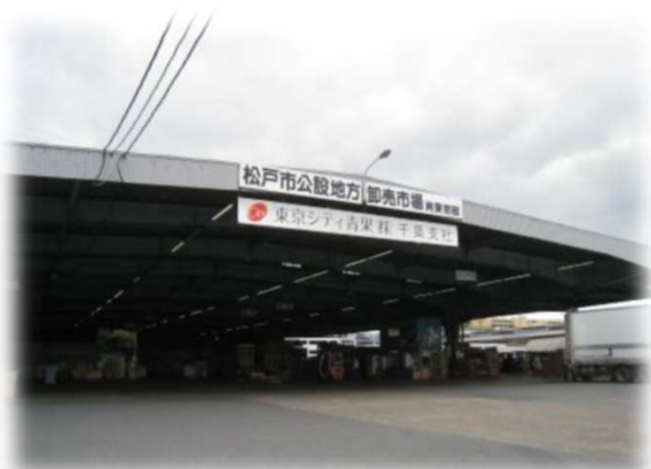
■以前の松戸市公設地方卸売市場 北部市場（卸売場） 平成29年3月31日をもって終了