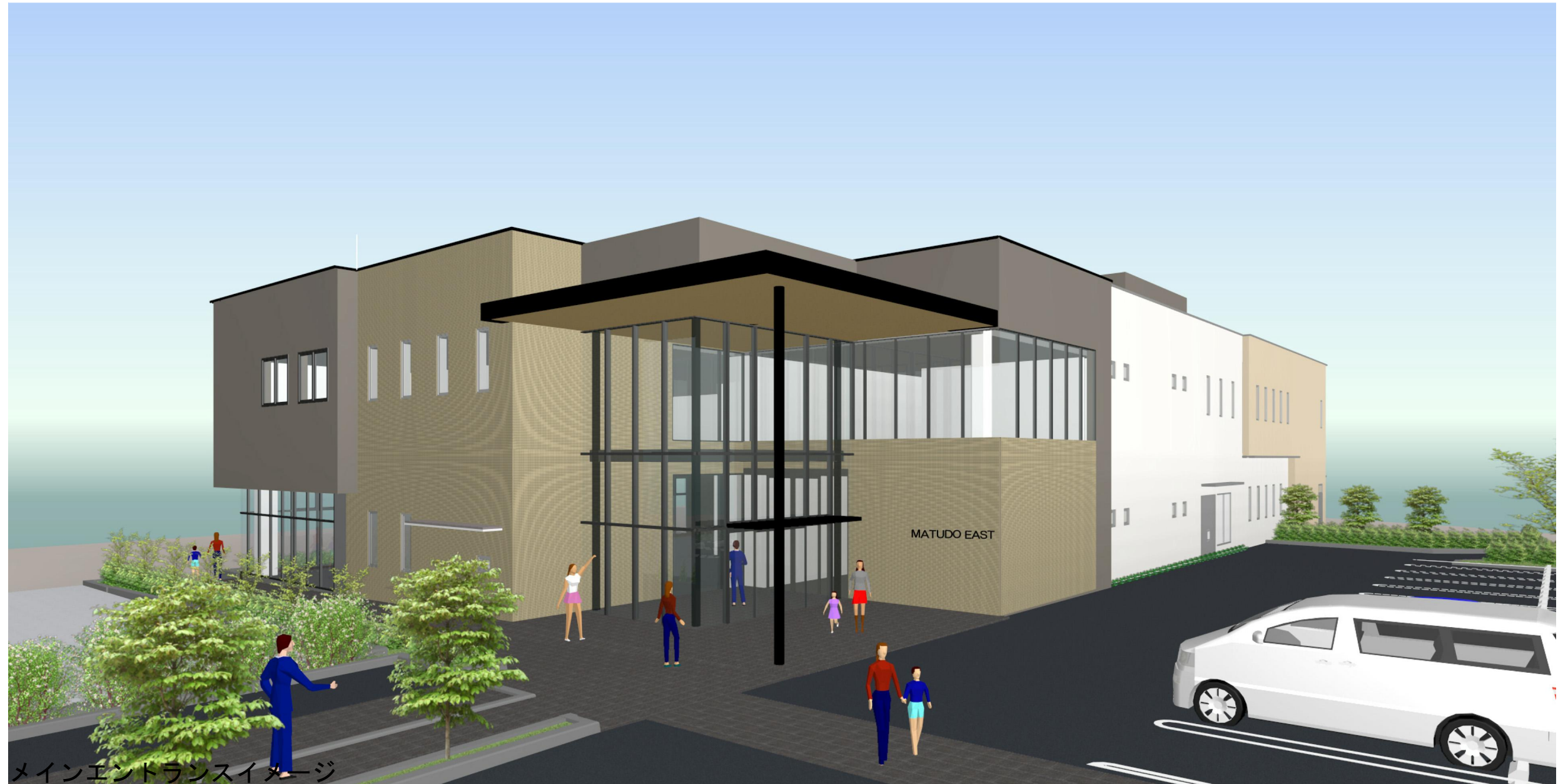
メインエントランスイメージ