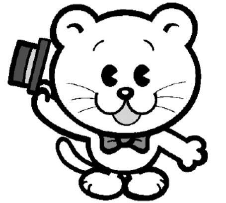
千葉県明るい選挙 シンボルキャラクター 「せんきよ君」

※期日前投票、不在者投票及び点字投票は、候補者氏名を投票用紙に記入する自書式投票になります。