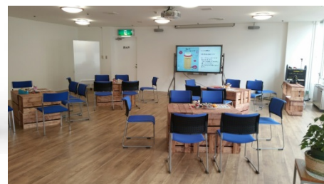
フューチャーセンター室内