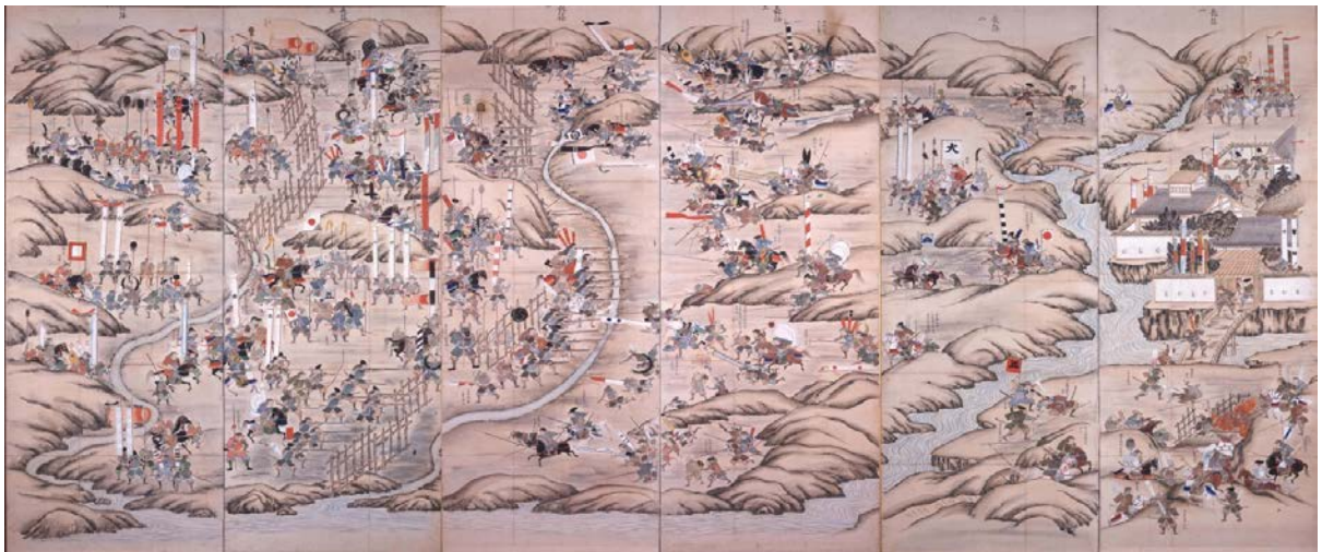
④ 長篠合戦図屏風（鉄砲3段撃ちはフィクション？） ながしのかつせんずびょうぶ