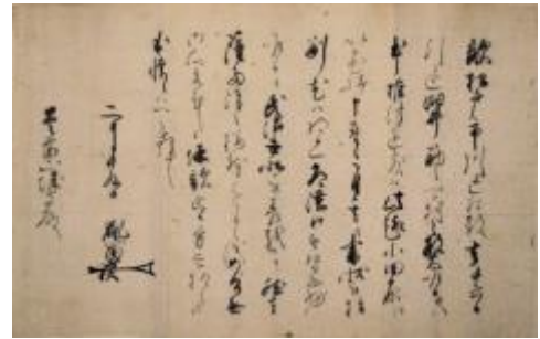
② 千葉胤富書状（松戸襲撃事件） ちばたねとみ