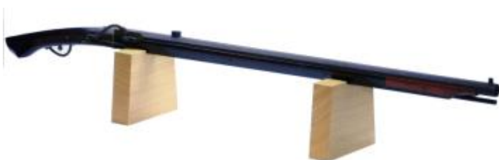
⑤ 火縄銃（日本最古かも） ひなわじゅう