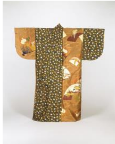
③ 縫箔 黒茶片身替鉄線 唐草薄扇散模様（能衣装） ぬいはく くろちやかたみがわりてっせん からくさうすおうざらしもよう