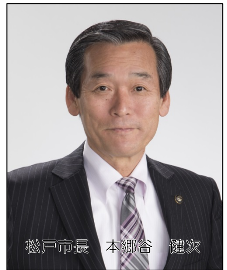
松戸市長 本郷谷 健次