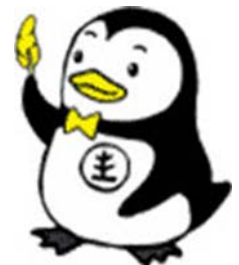
更生ペンギンのホゴちゃん