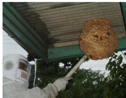
防護服を着た職員がハチの巣を駆除している様子

ハチの生態を知り、事前にハチの巣をつくらせない予防や初期のうちの発見が大切です。