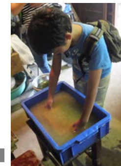
④ミキサーにかけた繊維を水に溶かせばいよいよ紙すきです。