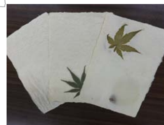
⑤数日間陰干しすれば完成!