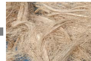
③鍋で煮て白でつくと繊維が残ります。