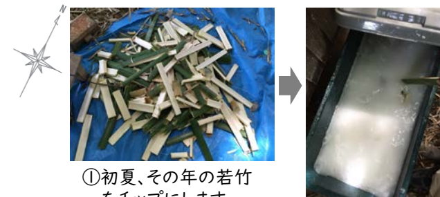
①初夏、その年の若竹をチップにします。