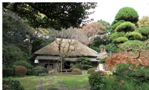
旧齋藤邸主屋と庭園