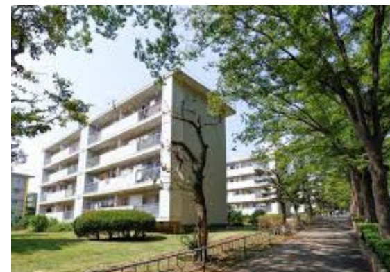
常盤平団地の様子