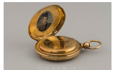
【金側葵紋付節公肖像入懐中時計】