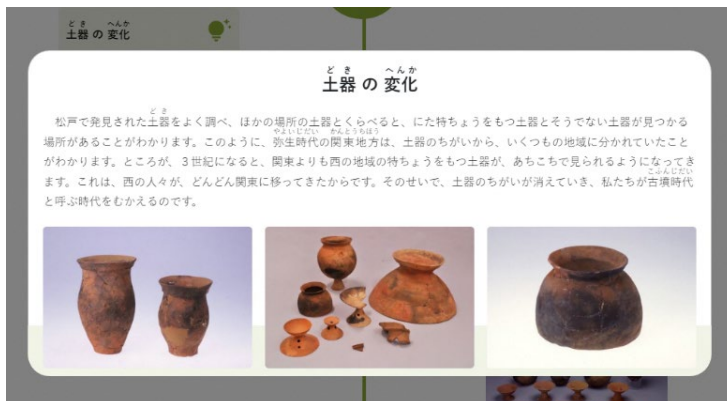
↑ 年表中の項目解説

旧石器時代から近代に至るまでの間の松戸の歴史に関する写真を添えて分かりやすく説明しています。説明のみならず、一部疑問を投げかけるなど子どもたちの探求心、想像力を養います。