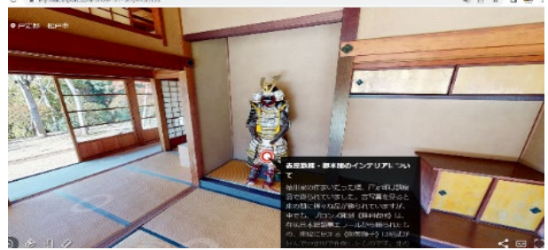
↑ 戸定邸バーチャルツアー