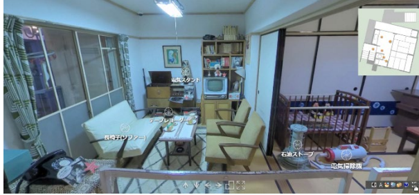
↑ 昭和の団地バーチャルツアー

戸定邸と昭和団地の2つのVRを提供しています。自宅や学校のパソコン、タブレットやスマートフォンなどから、実際に訪れたような臨場感を味わうことができます。ただ観るだけでなく、VR上に置かれたポイントをクリックすると詳細な説明を見ることが出来ます。