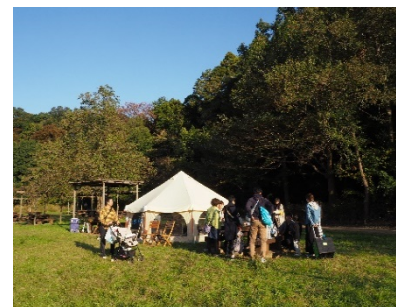
モリクルもりいくステーション