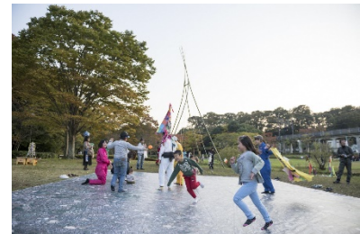
グローカルピクニック1の様子