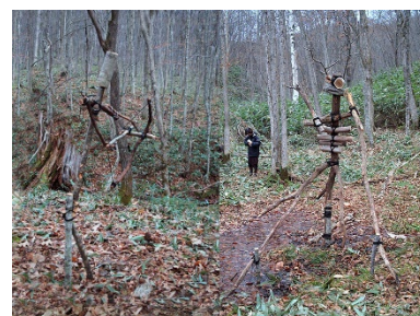
森を解すイメージ画像