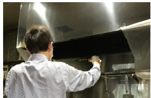
換気扇付近の風量計測の様子