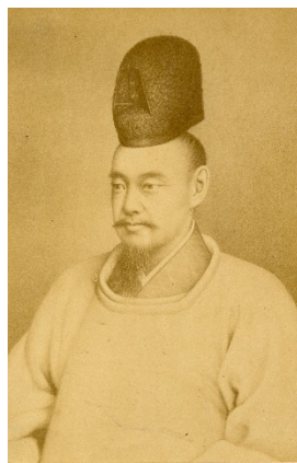
徳川齊昭肖像画写真