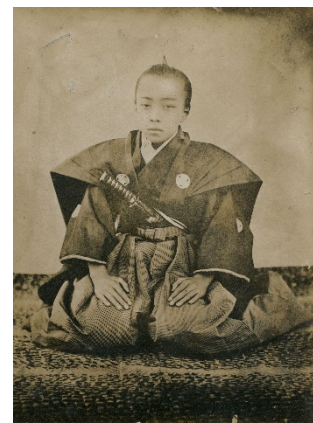
徳川昭武写真 1866 年