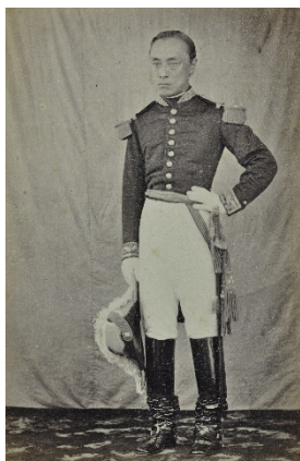
徳川慶喜写真 1866-67 年頃 （フランスから贈られた軍服姿）