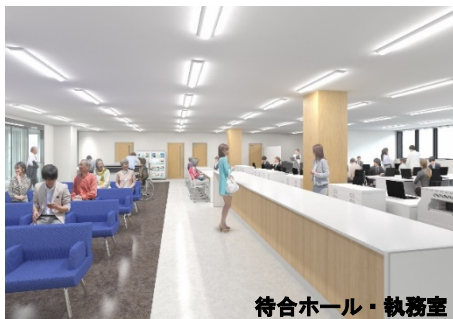
待合ホール・執務室

東部支所を移転し、交通アクセスの向上と狭さの解消を図ります。また、バリアフリーにも配慮し、来所者に安心してご利用いただけます。