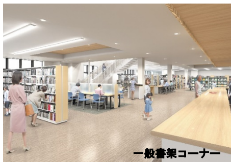
一般書架コーナー

松戸市初めての地域館が誕生。蔵書数の充実に加え、地域住民の社会教育活動、交流や学習活動の場を提供します。