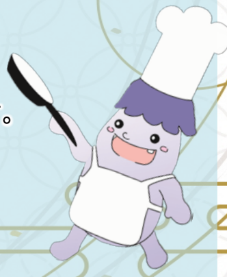
松戸市食育シンボルキャラクター・ぱくちゃん