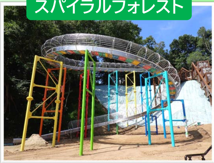
スパイラルフォレスト