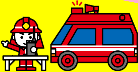
全国消防イメージキャラクター・消太