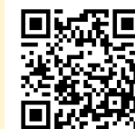
申し込みフォーム