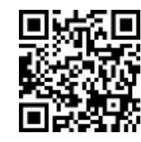
松戸市安全安心メール