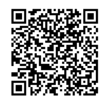
ちば大気環境メール