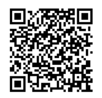
千葉県大気環境情報