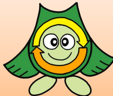
松戸市ごみ減量PRキャラクター・クリンクルちゃん

松戸市では、平成30年4月1日から燃やせるごみを紙袋で出せなくなります。現在も販売している「燃やせるごみ専用松戸市認定ポリ袋」のご利用をお願いします。