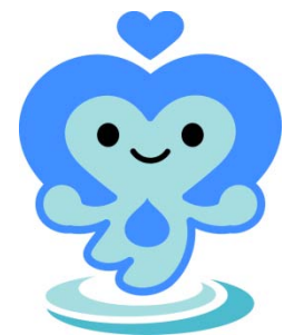
松戸市水道キャラクター 「まってい〜」