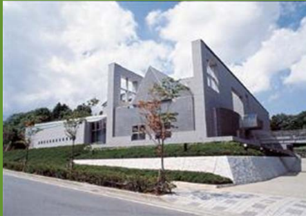
○市立博物館がオープン(平成5年)