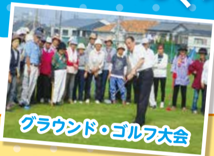
グラウンド・ゴルフ大会