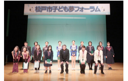
昨年度表彰された中学生