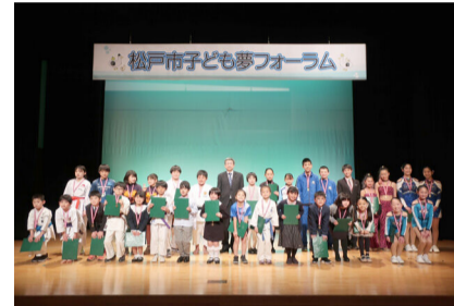
昨年度表彰された小学生

※手話通訳、一時保育(6カ月～就学前、先着5人、1月29日(月)までに電話で同課 ☎047-366-7464へ)有り。