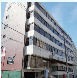
松戸商工会議所別館

働くことに悩みを抱えている人の相談を受け付けています。自分らしい働き方について相談員(キャリアコンサルタント)と話し合い、専門的なアドバイスを受けることができます。必要に応じて、就職準備セミナーや職場見学・体験、企業説明会に参加することもできます。