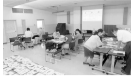
令和5年度消費者問題勉強会

応募資格: 以下の全てを満たす人 ●市内在住の18歳以上 ●食料品や衣料品などの生活必需品の販売に関係していない ●国および地方公共団体などの職員ではない ●公選による職に就任していない ●過去に市の消費生活モニターを経験していない ●趣旨をよく理解し、協力的な人