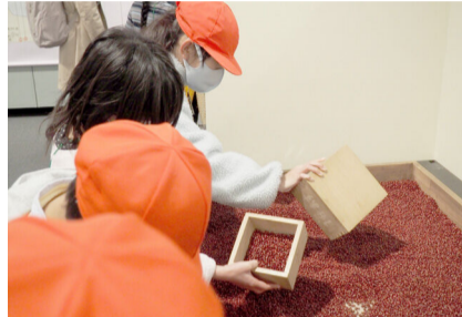
小豆を升で量る子どもたち