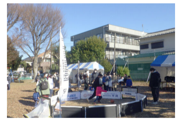
あべりあ公園で実施したトライアル事業