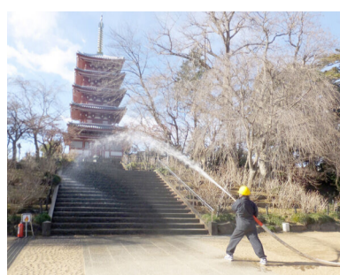
本土寺の消防訓練