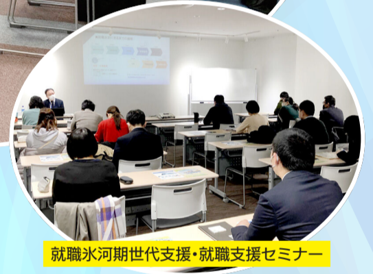
就職氷河期世代支援・就職支援セミナー

市では、市内で働きたい人や就職に不安がある人などに対して、さまざまな就労支援を行っています。「働きたいけどどうしたらよいか分からない」、「自信が持てず一歩が踏み出せない」という人は、まずはお気軽に個別相談をご利用ください。