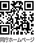
同庁ホームページ

確定申告期間中の税務署は大変混雑します。国税庁ホームページにある「確定申告書等作成コーナー」では、いつでも自宅などから申告書が作成できます。マイナンバーカード読み取り対応のスマートフォンなどを使用するとe-Taxで申告書が提出でき、税務署に行く手間が省けます。詳細は同庁ホームページをご覧ください。