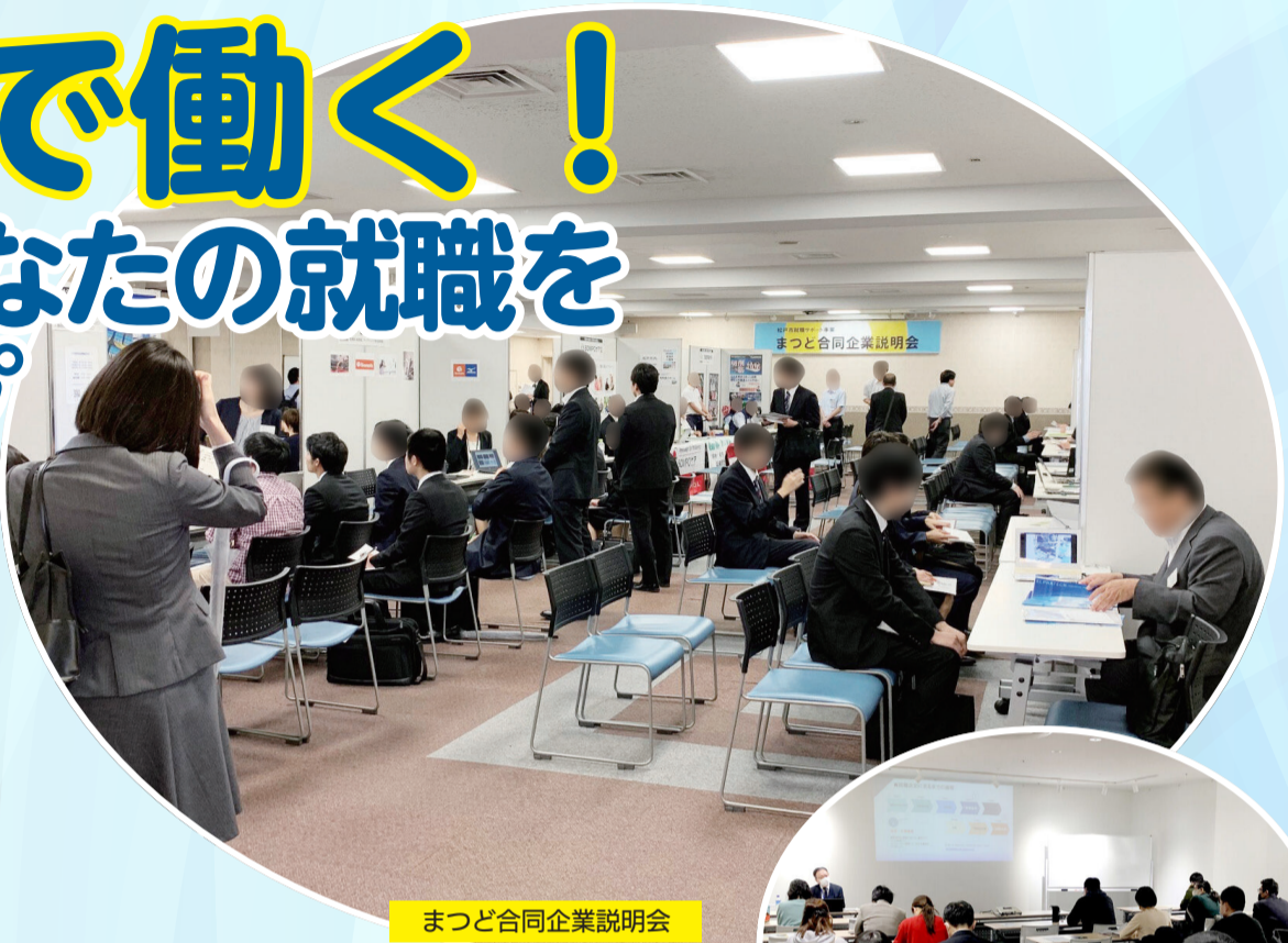
まっど合同企業説明会