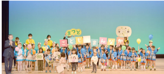
まつどこどもの笑顔応援フェスタ

11月12日に森のホール21で実施した「まつどこどもの笑顔応援フェスタ」で、市長が「こどもまんなか応援サポーター」への就任を宣言しました。