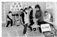
健康づくり活動の様子

健康推進員とは、市民の健康づくりのため市長から委嘱を受け、活動を行う人です。町会長・自治会長からの推薦に加え、公募による募集を初めて実施します。詳細は同課にお問い合わせいただくか、市ホームページをご覧ください。