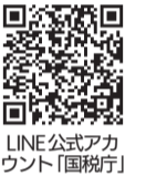
LINE公式アカウント「国税庁」