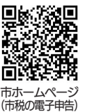
市ホームページ (市税の電子申告)

期限間近は窓口が混雑するため、1月19日(金)までの申告をお勧めします。地方税ポータルシステム(eLTAX)を利用した電子申告も受け付けています。詳細は市ホームページをご覧ください。