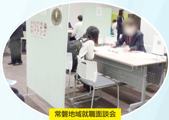
常磐地域就職面談会