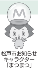
松戸市お知らせキャラクター「まつまつ」