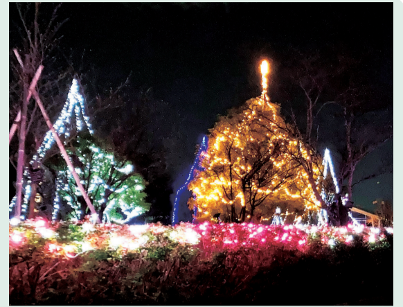
東松戸ゆいの花公園イルミネーション

同公園職員が園内の植物を案内します。 日時: 12月15日(金)10時集合、11時解散