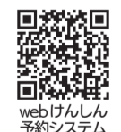
webけんしん予約システム