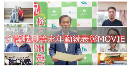
介護職員等永年勤続表彰MOVIE

市内で活躍する介護職員の姿を、受彰コメントと共に公開しています。ぜひご覧ください。