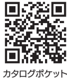
カタログポケット

広報まつどをスマートフォンで閲覧できます。10言語・自動読み上げに対応。Read in multi languages!