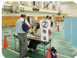
ワクチン集団接種