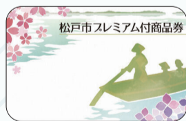
プレミアム付商品券（カード型）