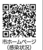
市ホームページ （感染状況）