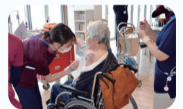
高齢者施設でのワクチン接種