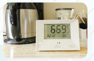
CO 2 モニター