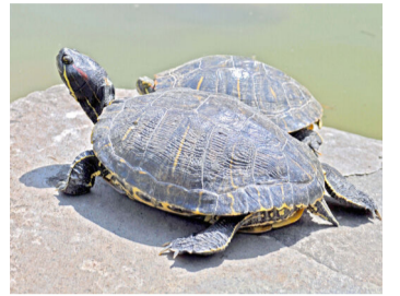
外来生物の例(アカミミガメ)

申 7月18日(火)9時から、申し込みフォームまたは電話で環境政策課 ☎047-366-7089へ