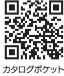
カタログポケット

広報まつどをスマートフォンで閲覧 できます。10言語・自動読み上げに 対応。Read in multi languages!