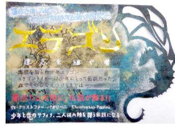
令和4年度中学生の部・最優秀賞作品

応募期間:8月1日(火)~9月15日(金)[必着] 対象:市内在住・在学の小・中学生 規格:大きさ148mm×210mm(A5判)まで(形は自由) 材質:画用紙程度の厚みのある紙 画材:自由 本の紹介:字数制限なし 甲 同館ホームページまたは同館に設置のチラシをご覧ください。