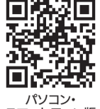
パソコン・スマートフォン版