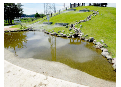
坂川親水広場「じゃぶじゃぶ池」