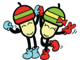
21世紀の森と広場シンボルキャラクター・ドンちゃん・グリちゃん