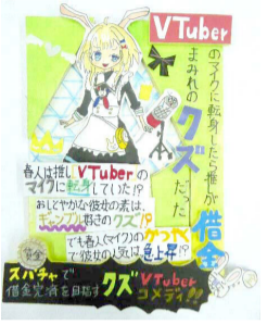
令和4年度小学生の部・最優秀賞作品