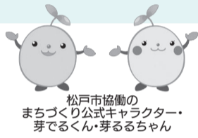
松戸市協働のまちづくり公式キャラクター「芽でるくん・芽るるちゃん」