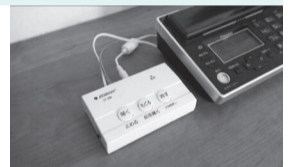
電話de詐欺撃退機器

☎電話でネコサポコールセンター☎0120-5454-25または、直接ネコサポステーション三ヶ月店(三ヶ月1328)・テラスモール松戸店(八ヶ崎2の8の1)へ