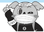
健康まつど21 マスコットキャラクター 「けあら」