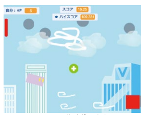
2021年Cygames賞 「上空nメートル」

市内の小中学生が作った、ゲームやアプリのコンテスト受賞作品10点を展示します。オリジナリティにあふれた楽しい作品を、ぜひ体験してみてください。