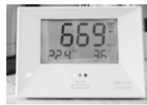
貸し出し用CO 2 モニター

自宅の換気状況を把握できるCO 2 モニターを無料で貸し出しています。換気状況を確認したい人や、親戚や友人などと集まる機会のある人は、ぜひご利用ください。 ※申し込み方法などの詳細は、同課に電話または市ホームページをご覧ください。