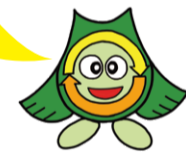
松戸市ごみ減らしシンボルキャラクター フリンクルちゃん

資源ごみで出せるビン類・缶類は 飲料・食品用に限ります 。それ以外のペンキ缶、一斗缶、薬品類・化粧品のビンなどは「不燃ごみ」になりますのでご注意ください。