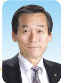
松戸市長 本郷谷 健次