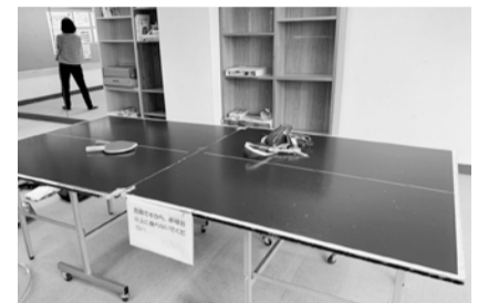
卓球台や遊具コーナーも