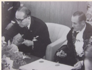
姉妹都市締結調印式 (1971年)