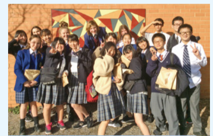
市立松戸高校とクワン校の生徒たち