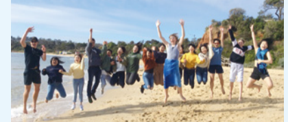
市立松戸高校とクワン校の生徒たち