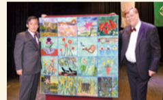
締結45周年記念式典 (ホワイトホース市にて)