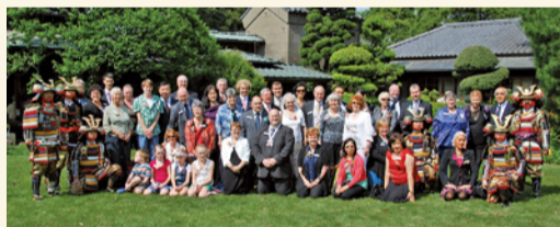
戸定邸で行われた「ともだちコンサート」(2012年)

5年ごとの姉妹都市締結記念日に、市長をはじめとする訪問団がお互いの都市を訪問してお祝いをしています！