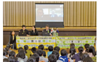
常盤平第三小学校で行われたオンライン会議

毎年、姉妹都市締結記念日に、市内の小学校で開催！両市で記念植樹とオンライン会談を行っています。児童が国際交流や異文化に触れる機会となっています。