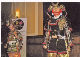
45周年歓迎会の甲冑お披露目