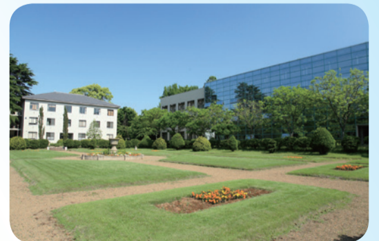
前回の景観大賞(まち並み部門) [千葉県大学園芸学部キャンパスおよび庭園群]

☎9月30日(月) [必着] までに、都市計画課で配布または市ホームページでダウンロードできる調書に必要事項を記入して、直接・Eメールまたは郵送で〒271-8588松戸市役所 都市計画課景観・指導班☐mctoshikeikaku@city.matsudo.chiba.jp(☎366-7372)へ