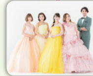
ザ ブリーズアドベンチャーズ

團 森のホール21チケットセンター ☎384-3331(10時～19時、月曜休館、月曜が祝・休日の場合は翌日休館)