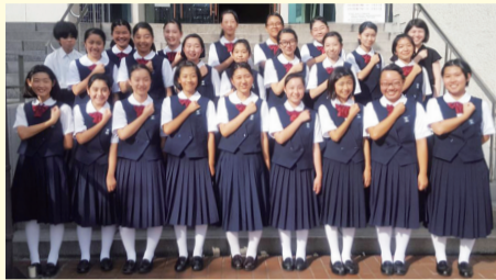
第四中学校合唱部

ゲスト出演第四中学校合唱部 曲名無伴奏女声合唱のための7つの子ども歌より『あんたがたどこさ』『ていんさぐぬ花』、『You raise me up』など