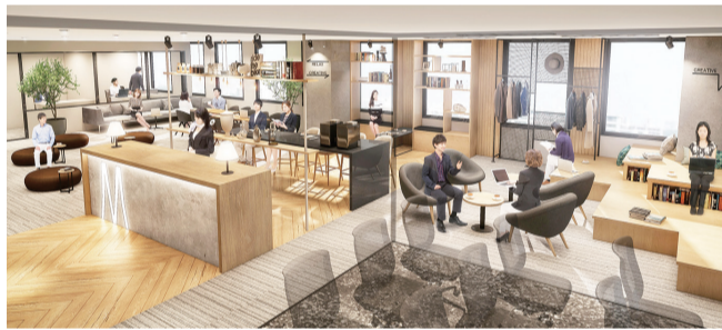
同オフィスのイメージ図