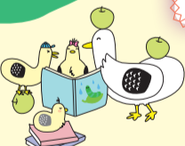
松戸市子育て 応援マスコット 「まつどり」