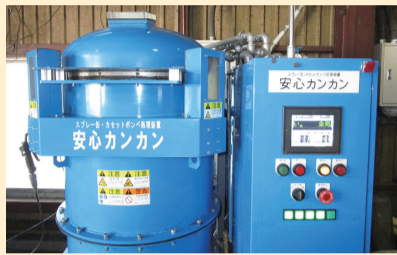
中身が残っていても専用設備で安全に処分できます

スプレー缶やカセットガスボンベの処分に困っている人は、資源リサイクルセンターに持ち込んでください。 ※事業活動で発生したごみは、持ち込めません。