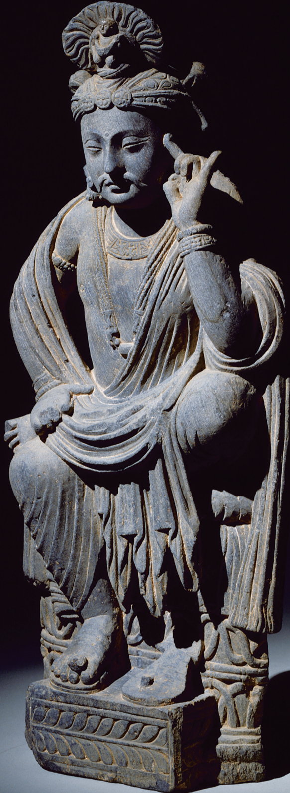
菩薩半珈像

仏教美術のふるさと、ガンダーラ。 仏像・彫刻をはじめとする仏教美術品やシルクロードの交易品から、 はるかなる仏教文化の世界をよみがえらせます。 さらに、日本で花開く仏教文化の始まりについて探ります。