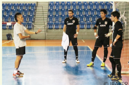
日本代表選手(2018年8月当時)を指導する内山さん(写真左)

言います。サッカーよりもコートが狭く、人数も少ないフットサルでは、攻守における全ての動作を素早く行わなければならないため、「観る、止める、蹴る、運ぶ」といった部分の細かさが求められるそうです。これらを鍛えるため、サッカーチームに所属しながら、フットサルスクールにも通う子どもも多いとのこと。「今年のワールドカップのブラジル代表の選手のうち、11人がフットサル出身でした」と教えてくれました。