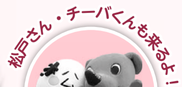
松戸さん・チーバくんも来るよ!