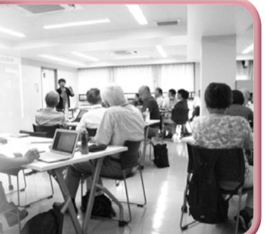
第1期まつど地域活躍塾(講義)の様子