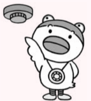
10年たったらとりカエル