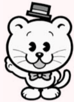
千葉県明るい選挙シンボルキャラクター「せんぎょ君」

4月17日(火)14時から 会場 市役所議会棟3階特別委員会室 ※立候補を予定している人は、事前に市選挙管理委員会事務局へ出席人数等を連絡の上、出席してください。 閩事務局☎366-7386