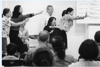
「コントdeげき隊」は、買え買え詐欺など身の回りで起こるトラブル事例を紹介