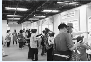
生活に役立つ情報が盛りだくさん！

くらしに役立つ情報が学べるイベントが盛りだくさん！出展団体のパネル展示や実演、ちびっこスタンプラリー、さらには消費者クイズに抽選会と、子どもから大人まで夢中になれるものばかりです。