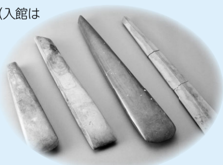
日本最大の石斧(上埴遺跡)