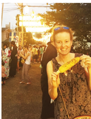
とうもろこしは絶品でした

季節がはっきりわかりました。それは夏でしょう! 私は、矢切ビールまつりで冷たいビールを楽しんだり、江戸川で打ち上げた夢花火に驚かされたり、献灯まつりで松戸宿の夏の名物とうもろこしをガツガツ食べたりしました。また、21世紀の森と広場で行われる「どこでもシアター」にも行って生音楽を聴きました。それが全て8月でした!