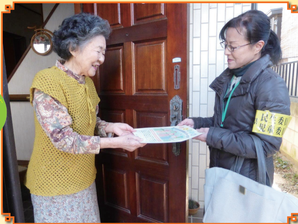
見守りや情報提供のために、高齢者宅への訪問活動を行う民生委員・児童委員(写真右)