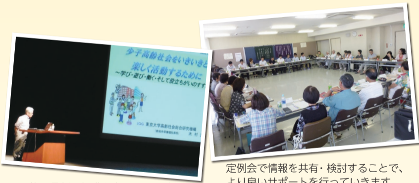
研修で最新の知識を身につけます