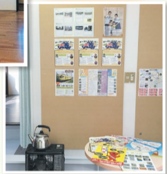
地域情報コーナー