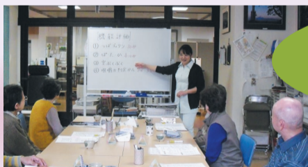
介護予防に取り組んでいます