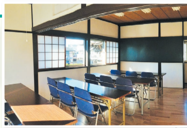
馬橋寺子屋(個人で教室を開くことができる貸し教室(定員20人))