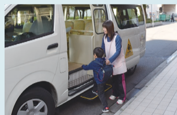
送迎保育ステーションでの送迎