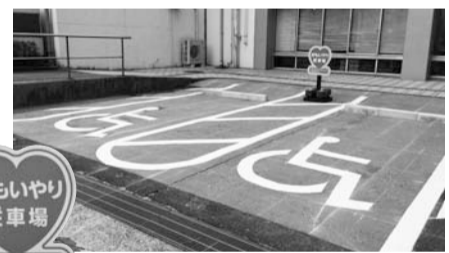
おもいやり 駐車場

障害者専用駐車区画に「おもいやり駐車場」の看板を設置し、妊娠中・体が不自由・障害のある人などがご利用しやすくなりました。