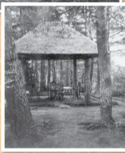
戸定邸南庭 あずまや 明治38年4月28日