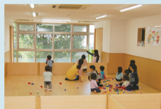
小規模保育事業施設での保育の様子