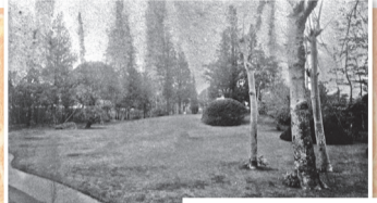
戸定邸庭園 明治22年5月4日