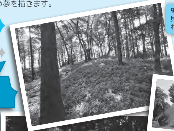
縄文時代後期の 貝塚の上に築か れた1号古墳