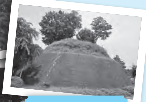
河原塚中学校の 敷地内にある4 号古墳