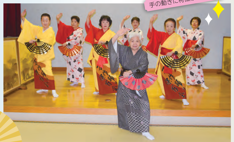
手の動きに特徴があります