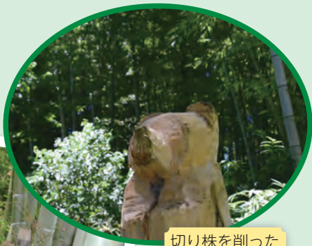
切り株を削った熊のオブジェ