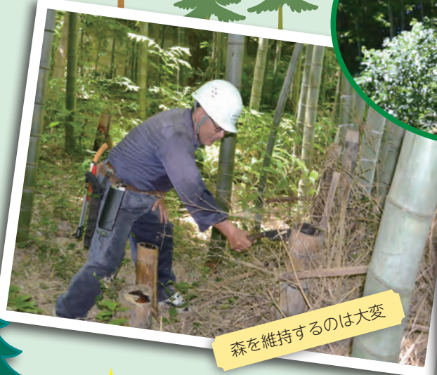
森を維持するのは大変