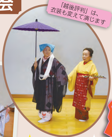
「越後評判」は、衣装も変えて演じます