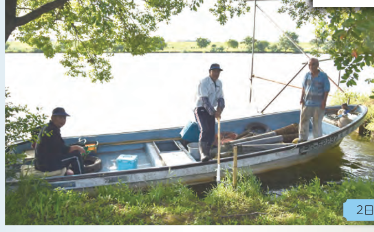
2日に1回、漁に出ます