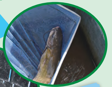
モクズガニやテナガエビ、大きなナマズも捕れます