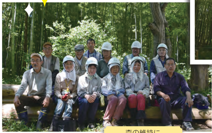
森の維持に力を尽くすメンバー

「松戸市の森林率は3%、これ以上松戸からみどりを減らしたくない」「次世代にこの自然環境を残したい」。そんな思いから集った仲間たちが、額に汗しながら森の手入れに精を出しています。