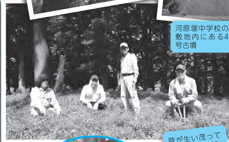
草が生い茂って いた空間をメン バーが地道に切 り開きました