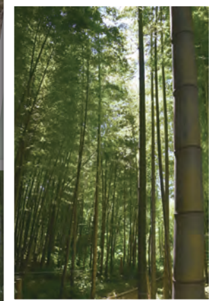
適度な手入れで明るい竹林に