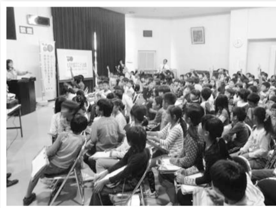
会議ではたくさんの意見がでました

「松戸市減CO2子ども会議」は11月6日、高木・松飛台小学校の4年生151人が参加して松飛台市民センターで開催しました。