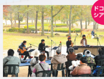
季節毎の美しい自然を背景に定期的に開催

毎月第3水曜日は、主に市議会議場を会場にクラシック音楽コンサートを開催しています。※次回は1月21日(水)に開催。