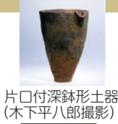
片口付深鉢形土器

幸田貝塚の出土品は縄文時代を研究する上で学術的価値が高いという理由で、1994年に国の重要文化財に指定されました。今回はこれまでに展示された回数の少ない資料を中心に公開します。縄文土器の逸品をご鑑賞ください。また、幸田貝塚の発掘調査の写真も展示します。併せてご覧ください。 12月13日(土)～25日(休)9時30分～17時(月曜日休館、入館は16時30分まで) 会場博物館企画展示室前ロビー 費用無料