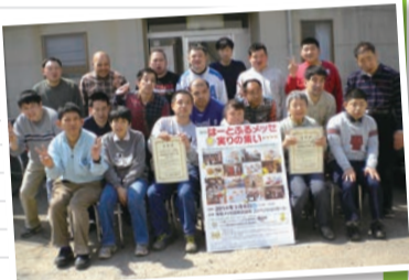
松里福祉作業所の皆さん

会場市役所1階連絡通路 内容松里福祉作業所(優秀賞)の「玄米ショコラ」(奨励賞)、ワーク・ライフまつさとの「松里煎餅」、とうふ工房・豆のちからの「豆腐製品」 問障害福祉課 ☎366-7348