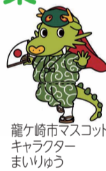
龍ヶ崎市マスコットキャラクター まいりゅう