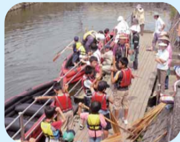
坂川に清流を取り戻す会の「坂川あそび」

市内河川の水質はずいぶん改善され、水鳥や魚も多くみられるようになりました。普段から家庭でできる浄化対策を心掛けることで、川はもっときれいになります。