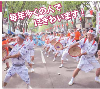
昨年(2012年)の新松戸まつりの花笠踊り

内容 鳴子踊り、花笠踊り、サンバパレード、助六流太鼓、子どもみこし、小・中学校バンド演奏、フラメンコ、ジャズダンス、ミニSL等