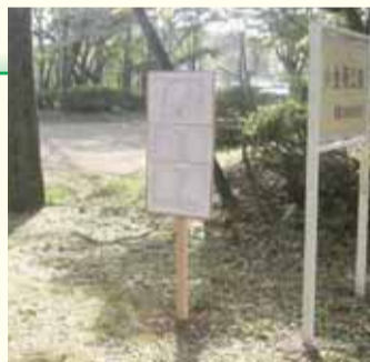
公園緑地ごとの放射線量マップを掲示しています

なお、公園緑地ごとの放射線量マップは、市のホームページや現地の看板で公表しています。