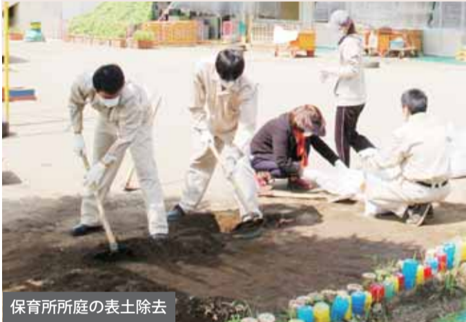
保育所所庭の表土除去