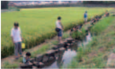
早くザリガニ釣れないかな...

8月23日(土)午前10時～午後1時(雨天時は24日(日)に順延) 会場坂川親水広場 内容ザリガニ釣り・どじょうつかみ・スーパースポーツ・Eボート体験乗船など 費用無料 圏河川清流課 ☎366-7359