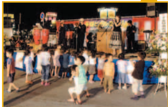
子ども大人も楽しめるイベントもりだくさん!

8月6日(水)・7日(木)〔雨天決行〕 午後6時～9時 会場北総鉄道矢切駅前広場 内容6日午後5時～6時オープニングセレモニー(矢切高校吹奏楽部の演奏)、6・7日よさこいソーラン、フラメンコ、プロの歌手の歌謡ショーなど 同日まつり実行委員会委員長・芝内☎090-27333-8854 ※駐車場・駐輪場などが少ないため、徒歩や公共交通機関をご利用ください。