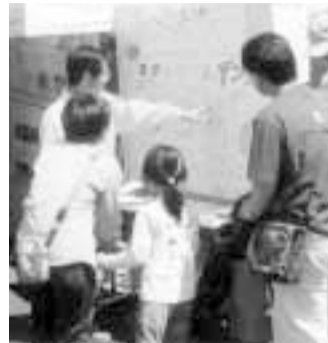
緑と花のフェスティバル スタンプラリー

市民公募による「みどりのマップづくり」を小金北部地区を対象に実践し、市役所や里やまシンポジウム会場で展示しました。