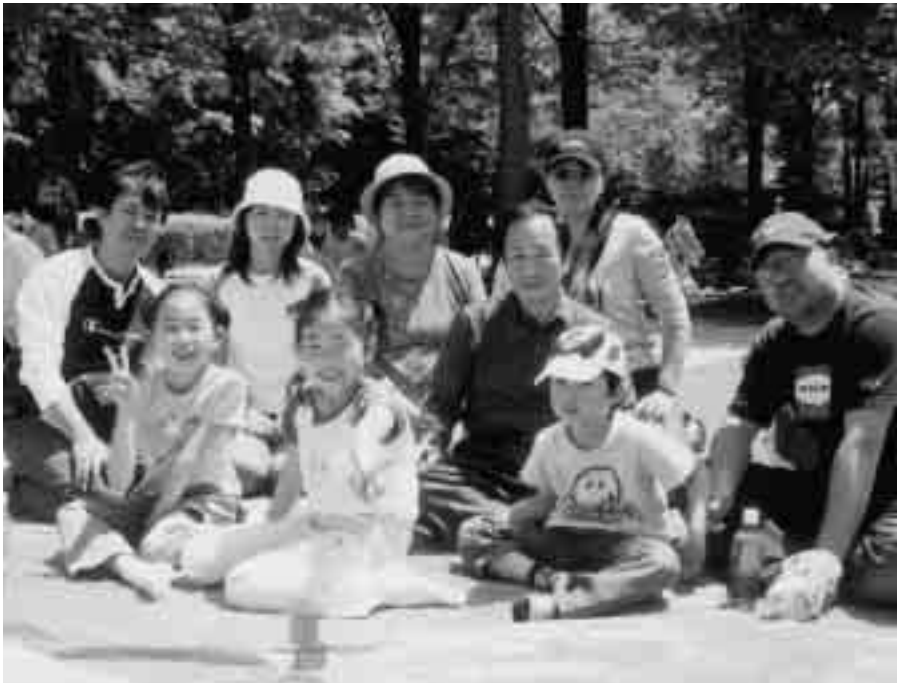
国民健康保険は助け合いの制度です(21世紀の森と広場にて)