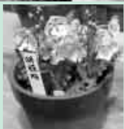
花卉・咲き方・咲く向き・花の大きさ・花の色が組み合わさって、一つの品種が構成されます