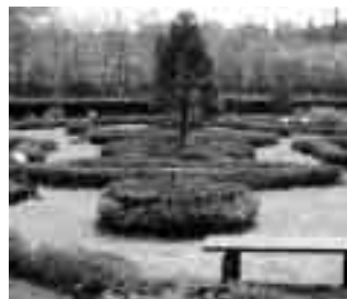
育苗圃の中にあるハーブ園