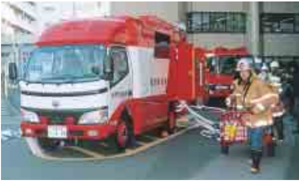
消防車としても出場できます