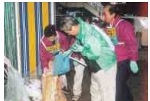
一緒にまちをきれいにしませんか