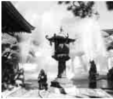
日ごろの訓練が大切です

市では、自主防災組織結成の相談を行っています。また、結成にあたって、防災資機材購入費の補助制度がありますので、防災課へお問い合わせください。