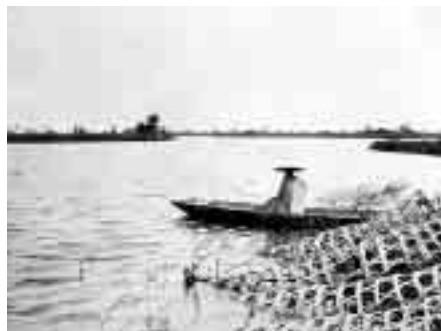
「小合沼釣魚(こあいぬまちょうぎょ)」