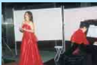
前回のミニコンサートから

生の演奏をお子さんと一緒に気軽にお楽しみください。 ☎社会教育課 ☎366-7462