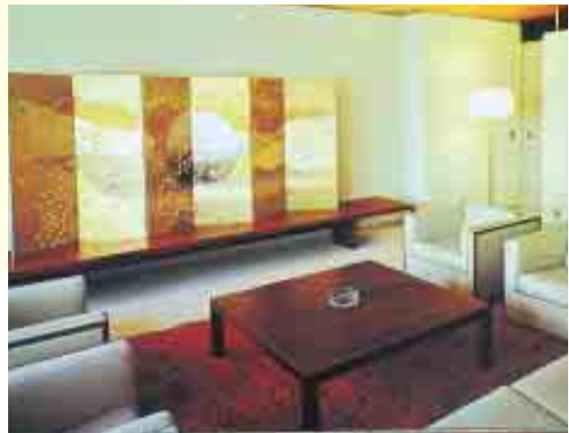
京王プラザホテル・インペリアルスイーツ