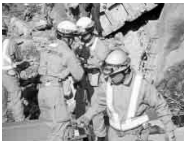
救出活動にあたる市消防局の救助部隊(長岡市妙見町で)

新潟県中越地震において、昨年松戸市は派遣要請を受け、被災地へ職員を派遣しました。また、市民の皆さんからも、多くの義援金(食)を職員五人により、長岡市内に寄せられています。義援金についての詳細は、次号で報告します。