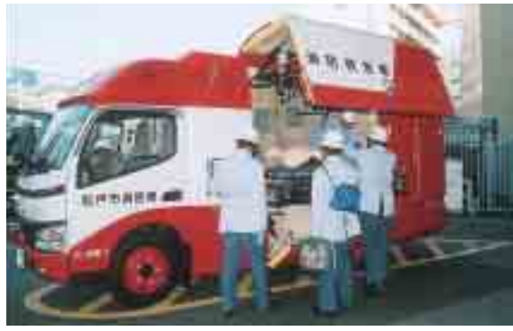
救急車としても出場できます

消防局では、日本で初めての「消防救急車」を導入し、1月7日、六実消防署に配備しました。